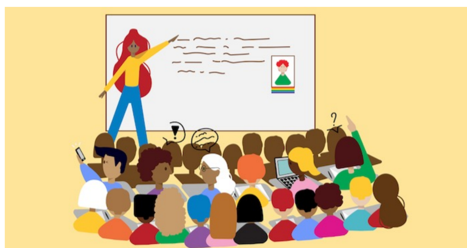
HUMAN Educatie is de nieuwe naam

Het educatieaanbod wordt doorlopend uitgebreid.