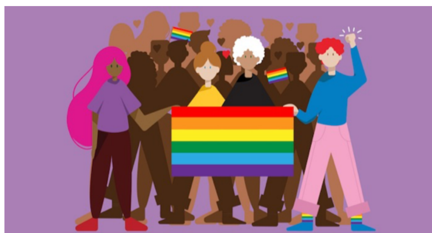
Seksualiteit bespreken in de klas