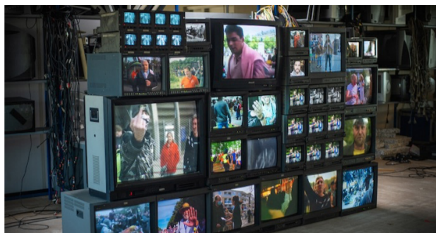
Argos Medialogica: Media en Desinformatie