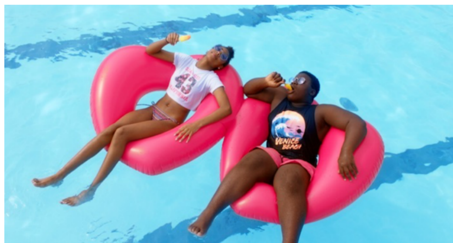
Kijken, luisteren en lezen in de vakantie