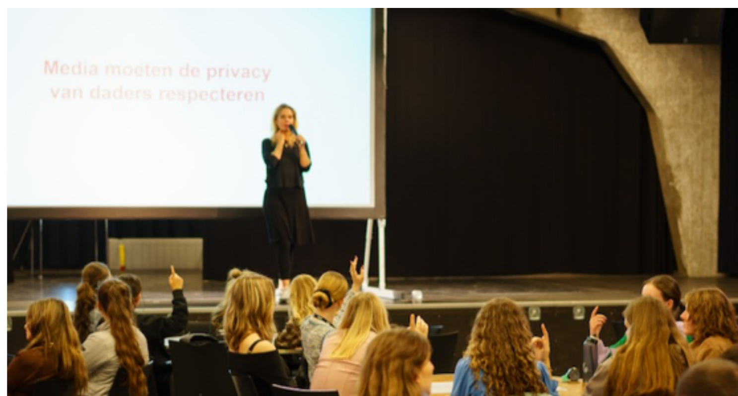
Masterclass Medialogica © HUMAN

We kijken met een goed gevoel terug op de afgelopen editie van filmfestival Beholders . HUMAN was mediapartner : niet alleen leverden we documentaires aan, we gaven ook aan meer dan honderd leerlingen onze Masterclass Medialogica . Wil je meer informatie en/of deze workshop ook boeken? Kijk dan hier .