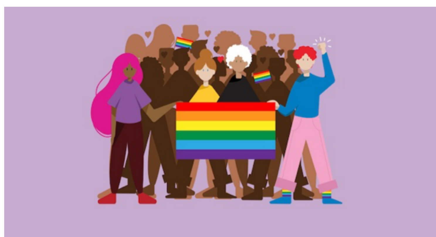
Onderwijs over seksualiteit en gender

De paarse bandjes zijn besteld, de posters liggen klaar om op school verspreid te worden en de GSA (Gender & Sexuality Alliance) is al druk bezig met voorbereidingen. Op vrijdag 9 december kleuren vele scholen paars om solidariteit met LHBTI+'ers te tonen. Paarse vrijdag staat in het teken van vrijheid, acceptatie en diversiteit. En dat is nodig. Uit onderzoek van Movisie blijkt dat Nederlandse LHBTI+'ers veel te maken krijgen met negatieve reacties en geweld. Nog steeds verbergen ruim twee op de vijf jongeren hun LHBTI+ identiteit op school. Onderwijs over seksualiteit en gender kan hen een steun in de rug bieden. Wil jij met de klas in gesprek gaan over deze thema's naar aanleiding van Paarse Vrijdag? Bij HUMAN vind je gratis lesmateriaal over gender en seksualiteit. Bekijk het hier .