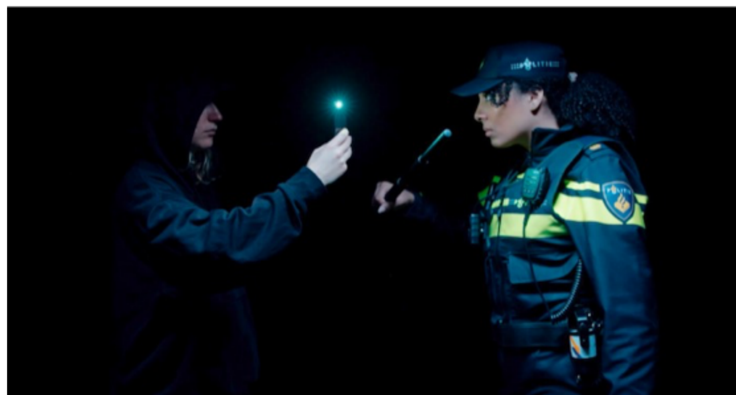
2Doc Kort: Beeldmacht